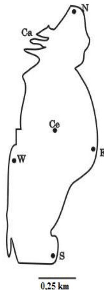
Figura 2. Laguna La Arocena. Estaciones de muestreo: N: Estación Norte; E: Estación Este; S: Estación Sur; W: Estación Oeste; Ca: Estación Canal; Ce: Estación Centro.

Se citan por primera vez para Argentina 16 (dieciséis) nuevos registros: Dichothrix fusca Fritsch; Arthrospira tenuis Brühl & Biswas, Oscillatoria subrevis f. maior G.S. West, O. proboscidea Gomont,