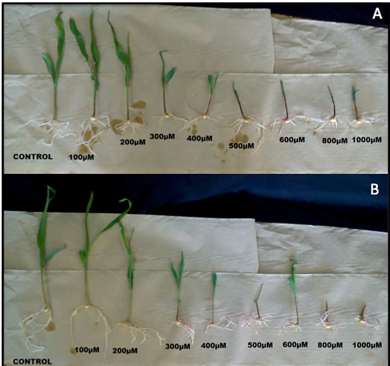
Figura 1. Plantas de maíz híbrido crecidas in vitro en medios con diferentes concentraciones de Cromo. A) Variedad Puma, B) Variedad Albatros. Las plantas son representativas de 18 individuos para cada tratamiento.

En la variedad Puma, el peso fresco de la raíz ( tabla 2 ) disminuyó por efecto del Cr(VI) desde la concentración de 200\ \mu\text{M} ( 1.98\text{ g} ) con respecto al control sin el metal ( 2.82\text{ g} ), con sucesivas disminuciones significativas en 300\ \mu\text{M} ( 1.29\text{ g} ) y 400\ \mu\text{M} ( 0.88\text{ g} ). En la variedad Albatros el peso fresco de la raíz disminuyó de manera significativa en la concentración de 200\ \mu\text{M} ( 1.22 ), con respecto al control sin Cr(VI) ( 1.95\text{ g} ), con otra disminución significativa en 400\ \mu\text{M} ( 0.87\text{ g} ).